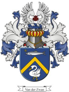
Van der Zwan