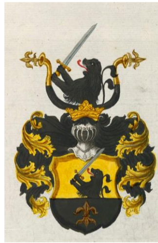
Breidtschwerdt (foute weergave)