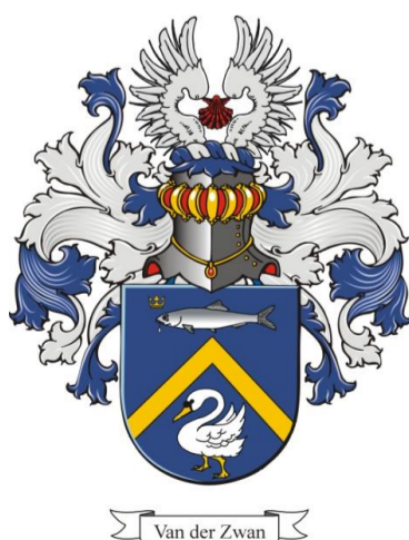
Van der Zwan