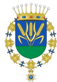
Richard Karl Freiherr von Weizsäcker Ritter in die Seraphinenorde