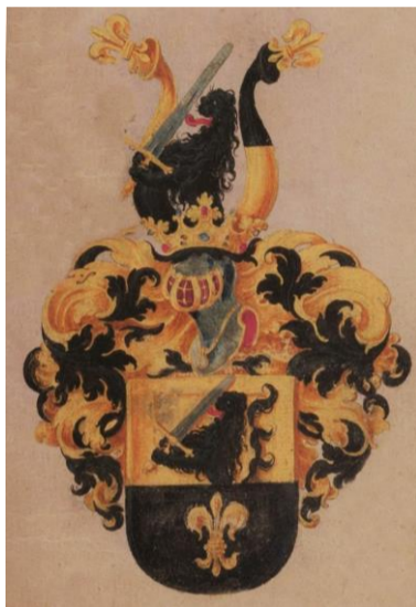
Breitschwert (24. Juli 1594)