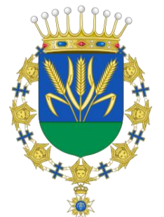
Richard Karl Freiherr von Weizsäcker Ritter in dem Seraphinenorden