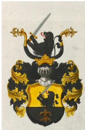
Breitschwert (Falsche Anzeige)