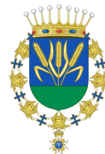
Richard Karl Freiherr von Weizsäcker Ritter in dem Seraphinenorden