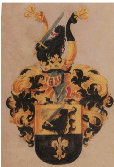
Breitschwert (24. Juli 1594)