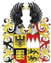
© Schwäbisch Hall / Lelystad 10. März 2021

| Rudolf II König von Böhmen und Ungarn / Kaiser (1552 - † 1612)