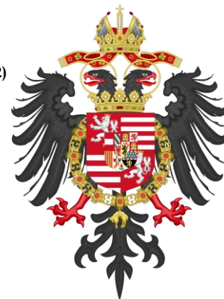
Ferdinand I von Habsburg Großwappen römisch-deutscher Kaiser