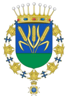
Richard Karl Freiherr von Weizsäcker Ritter in dem Seraphinenorden