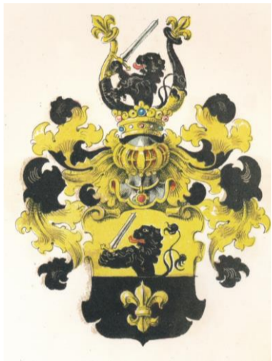
Breitschwert (24. Juli 1594)