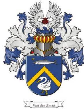
Van der Zwan