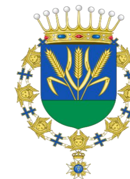
Ritter von dem Seraphinenorden