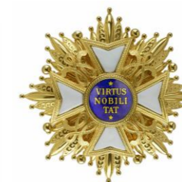
Groß Kreuz von dem Orden des niederländischen Löwen