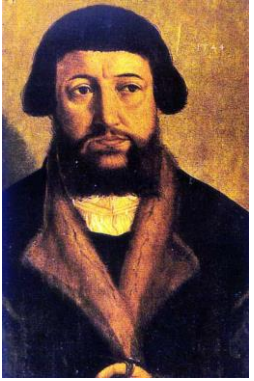
Andreas Osiander 1498 - 1552