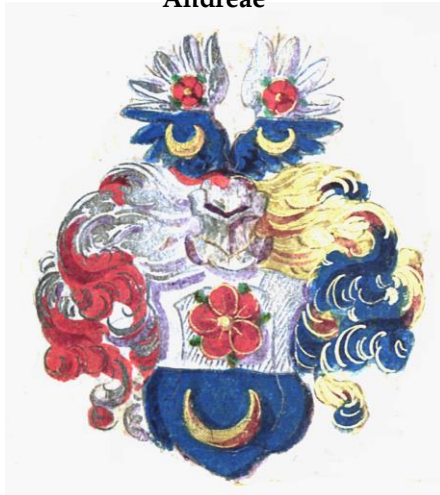
Andreas Osiander 1562 - 1617