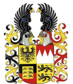
© Schwäbisch Hall / Lelystad 1. Juli 2021.