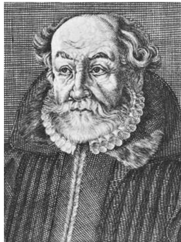
Jacobus Andreae 1528 - 1590