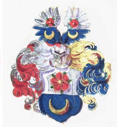
Andreas Osiander 1562 - 1617