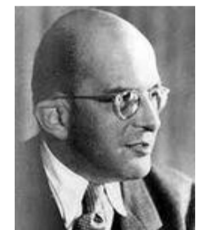
Erwin Gottlieb Adelbert Otto Planck