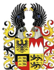
Verein für Genealogie in Nordwürttemberg e.V. © 4. Dezember 2023.