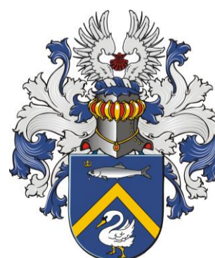
Van der Zwan *