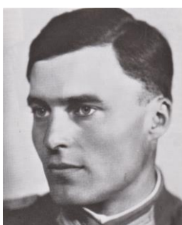
Claus Philipp Maria Schenk Graf von Stauffenberg (1907 - 1944)