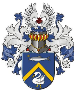
VAN DER ZWAN