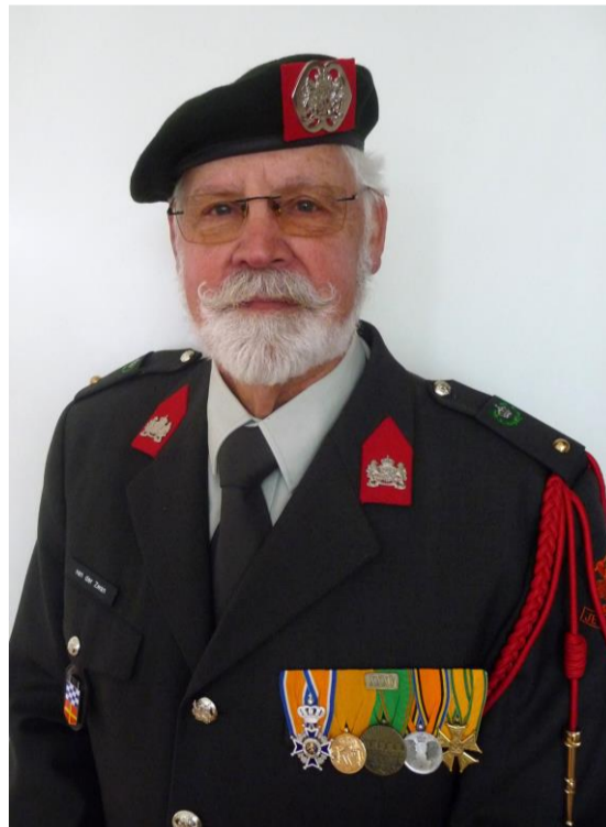
Adjutant Infanterie Korps Nationale Reserve (Ober Stabsfeldwebel i.R.) Ritter 6. Grades in dem Orden von Oranje-Nassau